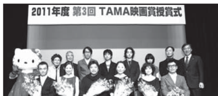
第3回TAMA映画賞受賞式より

また、第13回を迎えるTAMA NEW WAVEも作品募集中です。こちらもご期待下さい。